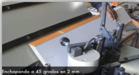
ENCHAPADO EN CORTE DE 45°